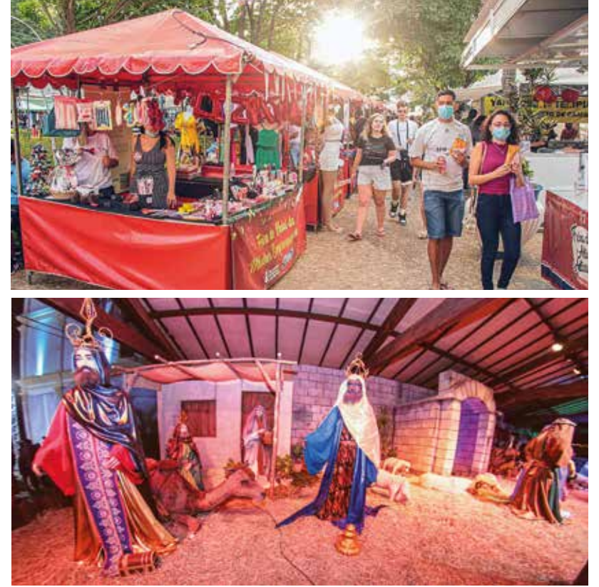
Em diversos pontos do centro da cidade, a prefeitura enfeitou com mais de 50 mil lâmpadas, abrillantando ainda mais a magia e o espírito natalino na cidade de Santana de Parnaíba

Na última sexta-feira (03/12), a magia do natal tomou conta de Santana de Parnaíba. A Prefeitura inaugurou na Praça 14 de Novembro o "Natal de Luz 2021" que contou com diversas atrações para toda família, entre