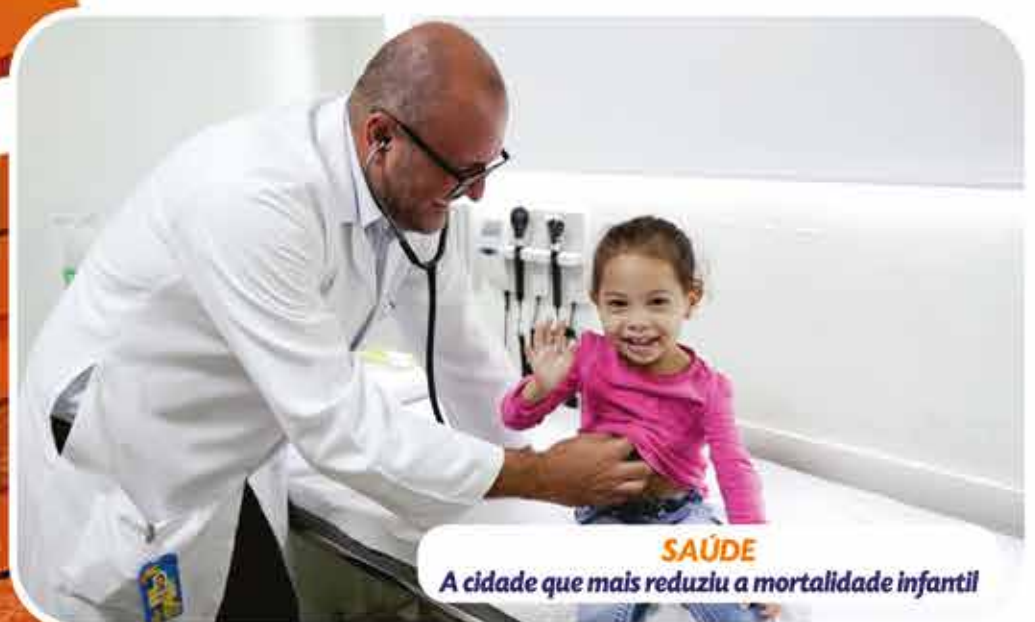
SAÚDE A cidade que mais reduziu a mortalidade infantil