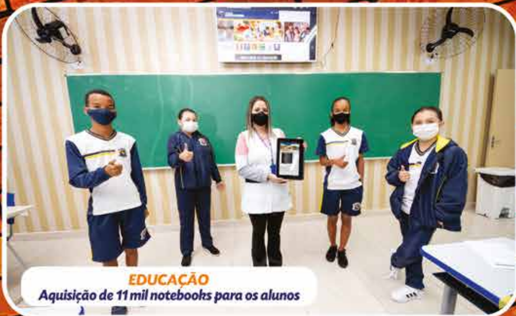
EDUCAÇÃO Aquisição de 11 mil notebooks para os alunos

Nos anos de 2013, 14, 15, 16, 18, 20 e 21 o tributo não sofreu reajuste; e para o exercício de 2022 o valores seguirão sem aumento