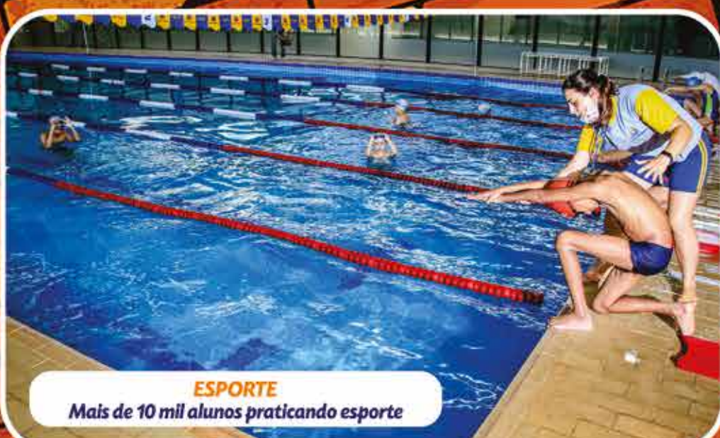
ESPORTE Mais de 10 mil alunos praticando esporte