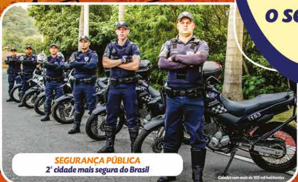
SEGURANÇA PÚBLICA 2ª cidade mais segura do Brasil