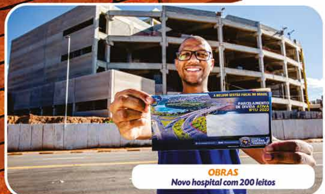
OBRAS Novo hospital com 200 leitos

Na última terça-feira, (07/12), a Câmara Municipal de Santana de Parnaíba aprovou por unanimidade, na 36ª sessão ordinária, o Projeto de Lei 374/ 2021, de autoria do poder executivo, que propõe o congelamento do Imposto Predial Territorial e Urbano (IPTU) para o exercício de 2022. Com isso, será a 8ª vez nos últimos 9 anos em que o tributo seguirá sem reajuste, já que além do ano vigente, onde não houve alteração nos valores, o IPTU também se manteve con-