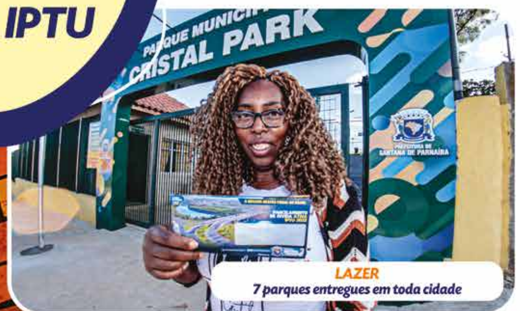
LAZER 7 parques entregues em toda cidade