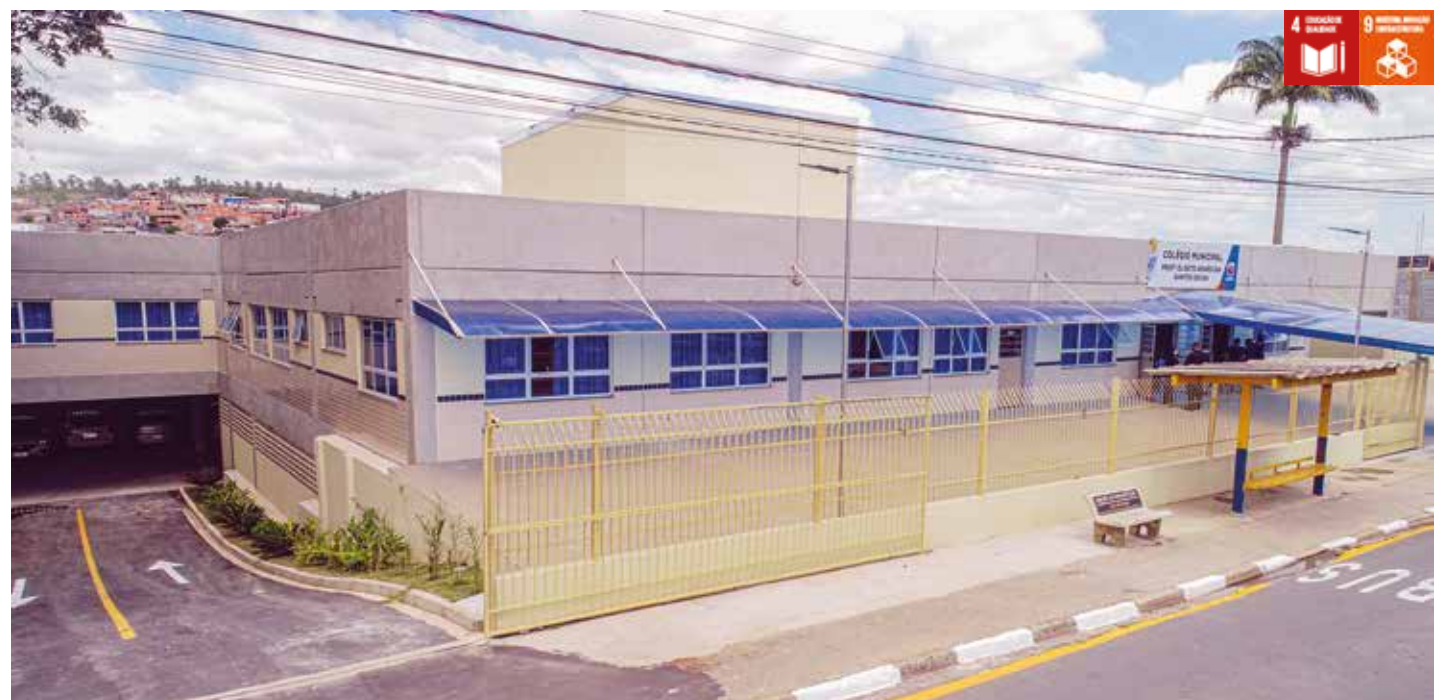
O novo colégio do Cento e Vinte irá atender até 250 alunos da região

Nos últimos 8 anos, a Prefeitura de Santana de Parnaíba realizou o maior investimento da história na educação, alcançando marcas como o maior crescimento percentual do IDEB e entregando 24 novos colégios em diversas regiões do município.