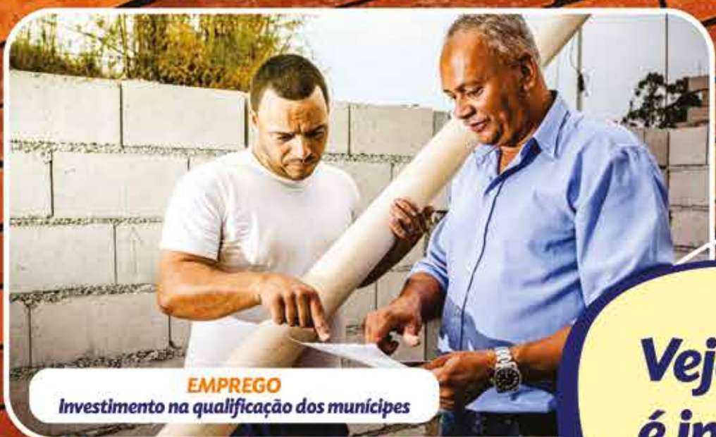
EMPREGO Investimento na qualificação dos munícipes