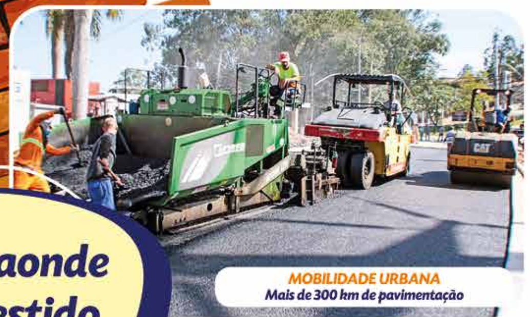
MOBILIDADE URBANA Mais de 300 km de pavimentação